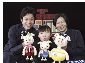
防災人形劇「さんびきのこぶた危機一髪」