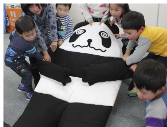
防災ワークショップの様子

2016年度から、全国の自治体・学校・企業と協働した防災イベントなどで展開し、これまで50,000名を超える市民の皆さまに参加いただいています。