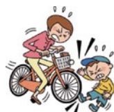
自転車で他人にケガを 負わせた