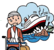
船が転覆してケガ