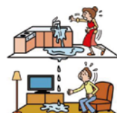
階下(他人の家)に 水漏れを出した