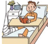
通り魔に遭遇し 重度後遺障害を被る