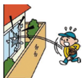
他人の家のガラスを壊した