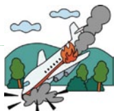
飛行機が墜落して死亡