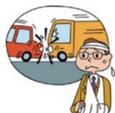
車が衝突してケガ