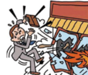
海外でテロに まきこまれて死亡