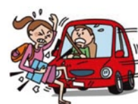
ひき逃げにあい死亡