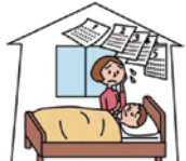
工作中的事故により 要介護状態になった