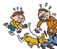
飼い犬が他人に噛みついて ケガを負わせた