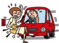
交通事故により 要介護状態になった