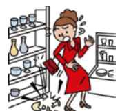
お店の商品を壊した